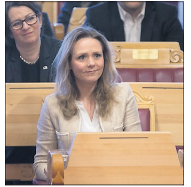
KULTURMINISTER: Linda Hofstad Helleland (H)

Forslaget til ny lov skal erstatte gjeldende åndsverklov fra 1961, en lov som ifølge regjeringen framstår som fragmentert og vanskelig tilgjengelig.