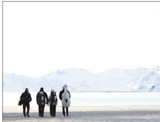
Engedårkvar tetten, stifta i Lofoten i 2006, spelar strykekvartettar av Wolfgang Amadeus Mozart (1756–1791).

Det undrar difor ikkje at austerrikarane utvikla antipatiar