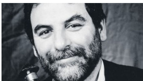
Tyrkiske Kudsi Erguner er en av verdens fremste innen sufimusikken.