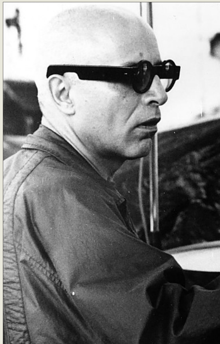
PREGET JAZZHISTORIEN: Trommeslager Paul Motian (1931–2011) hadde en variert

DE TO FØRSTE platene «Conception Vessel» (1972) og «Tribute» (1975) har sterke likhetstrekk med Charlie Hadens «Liberation Music Orchestra», typiske reaksjoner på den ustabile, politiske situasjonen