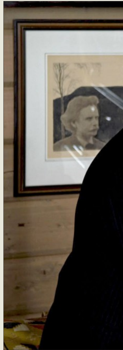
SPILL OG DANS: To aktuelle plater presenterer

skrevet i en periode da Egge – som flere andre norske komponister – eksperimenterte med det folkemusikalske stoffet. Med tiden skapte han sitt eget, personlige komposisjons-system ved å bryte ned folkemusikkens skalaer og sette