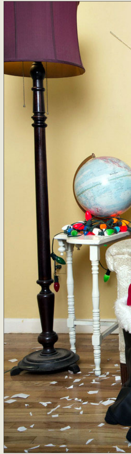
UORTODOKS JUL: Sufjan Stevens markerer julen