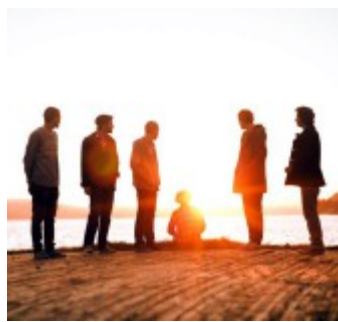
PLATEDEBUTERER: Bandet Ekkolodd på vinyl 22. mars.

Sjøl definerer bandet musikken sin som «drømmepop», inspirert av post-rock og jazz.