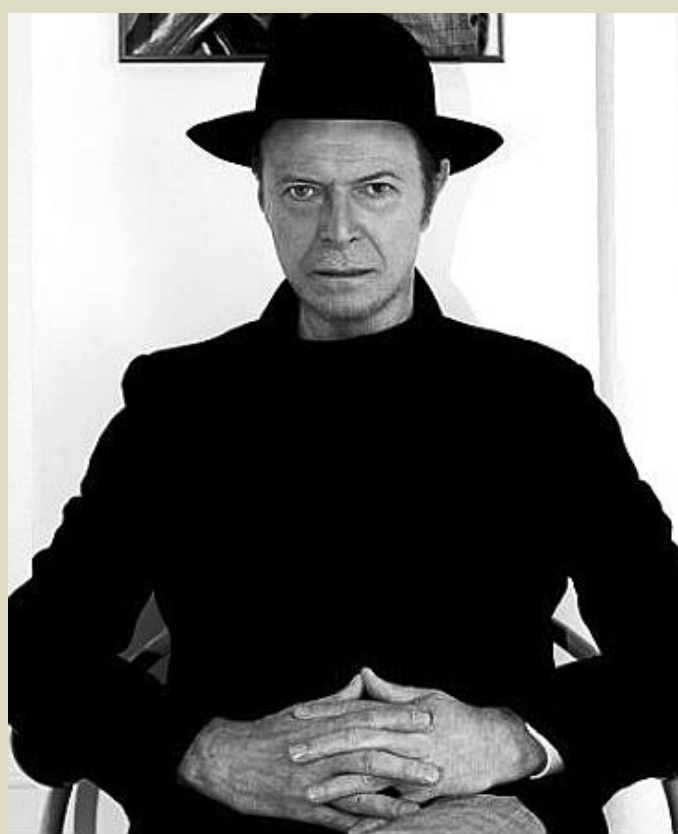
VOKSEN ARTIST: I likhet med Wenche Myhre er David Bowie 66 år. Men der stopper likheten.

Bak seg har han den kanskje mest bemerkelsesverdige karrieren noen britisk soloartist har hatt. Derfor tar han en stygg risk med å komme tilbake nå med nytt stoff, som 66-åring, etter så mange år ute av bildet.