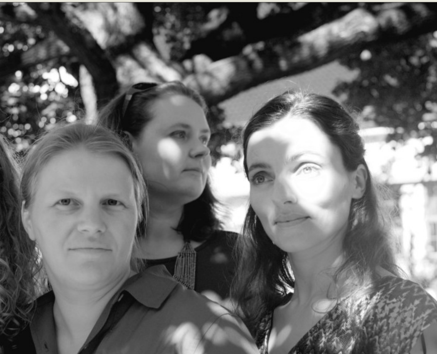
utgjør kvartetten Spunk. De har i tolv år jobbet med en større tematisering av den tempererte skalaen. Nå gis det hele ut på plate.