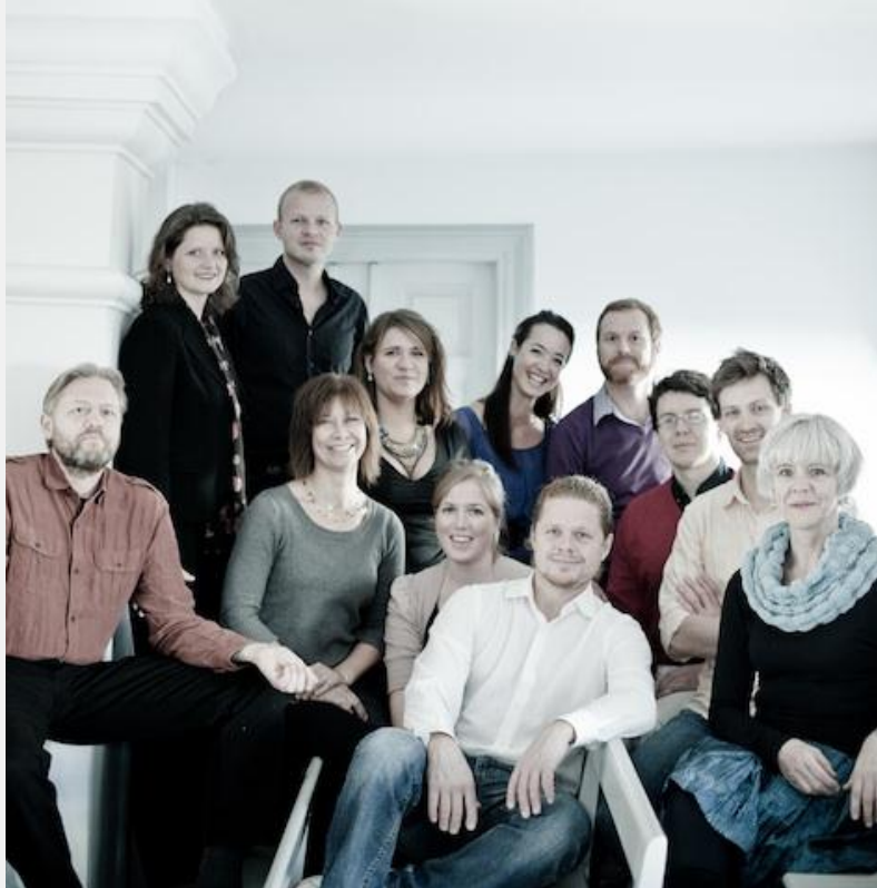
Ars Nova Copenhagen.

”The Christmas Story” er etter min mening årets beste juleplate, og jeg har hørt mange. For meg er julefryd og glede to viktige stikkord i jula. Det er det motsatte av bakgrunnsmusikk og passivt klangteppe. På denne platen får jeg naiv julefryd med personlige tolkninger, og sofistikert korklang i ett. Et høydepunkt er Ars Nova Copenhagens versjon av 1300-tallsmelodien Jeg synger julekvad. Da kan man høre julefryden krible over CD-rillene.