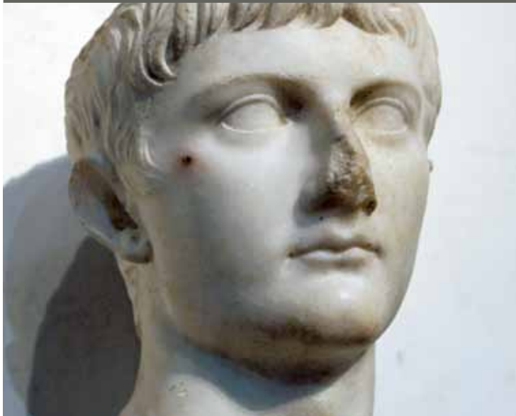
Helten i stykket, slik han er å sjå i Museo Nazionale Romano: Feltherren Germanicus (15 f.Kr.–19 e.Kr.), som fór ille med germanarane ved Rhinen.