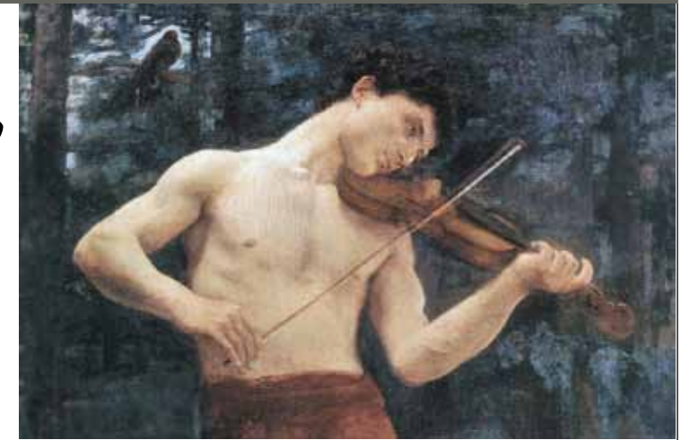
I musikken blir lyra til Orfeus gjerne framstilt gjennom ein fiolin. Her Orpheus , måla av den ungarske kunstnaren Károly Ferenczy (1862–1917) i 1894.

Då heile verda for to år sidan markerte Haydns dødsår, var det få som kom i hug at ein annan stor symfonikar hadde rund dødsdag same året: Mannheimaren Franz Ignaz Beck (1734–1809) etterlét seg, til liks med den austerriske kollegaen sin, eit omfemnande symfonisk oeuvre, han medverka til utvik-