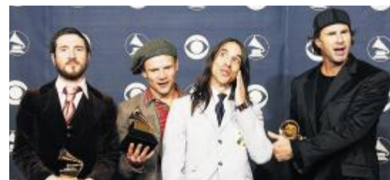
Chad Smith (fra høyre), Anthony Kiedis og Flea er snart plateaktuelle. Siden sist har gitarist John Frusciante (lengst til venstre) forlatt Red Hot Chili Peppers.

■ Red Hot Chili Peppers er snart klare med nytt album. 29. august kommer bandets tiende platen, som har fått tittelen I'm With You . NME melder at albumet er produsert av Rick Rubin. Det blir den første med bandets nye gitarist, Josh Klinghoffer, som erstattet John Frusciante i fjor. I juli kommer den første singelen. Den har fått tittelen «The Adventures of Raindance Maggie». Red Hot Chili Peppers forrige album, dobbeltalbumet Stadium Arcadium utkom i 2006. ©NTB