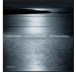
CD Gidon Kremer og Kremerata Baltica mfl. «Hymns and Prayers» Verk av Tickmayer, Franck og Kancheli ECM, 2010