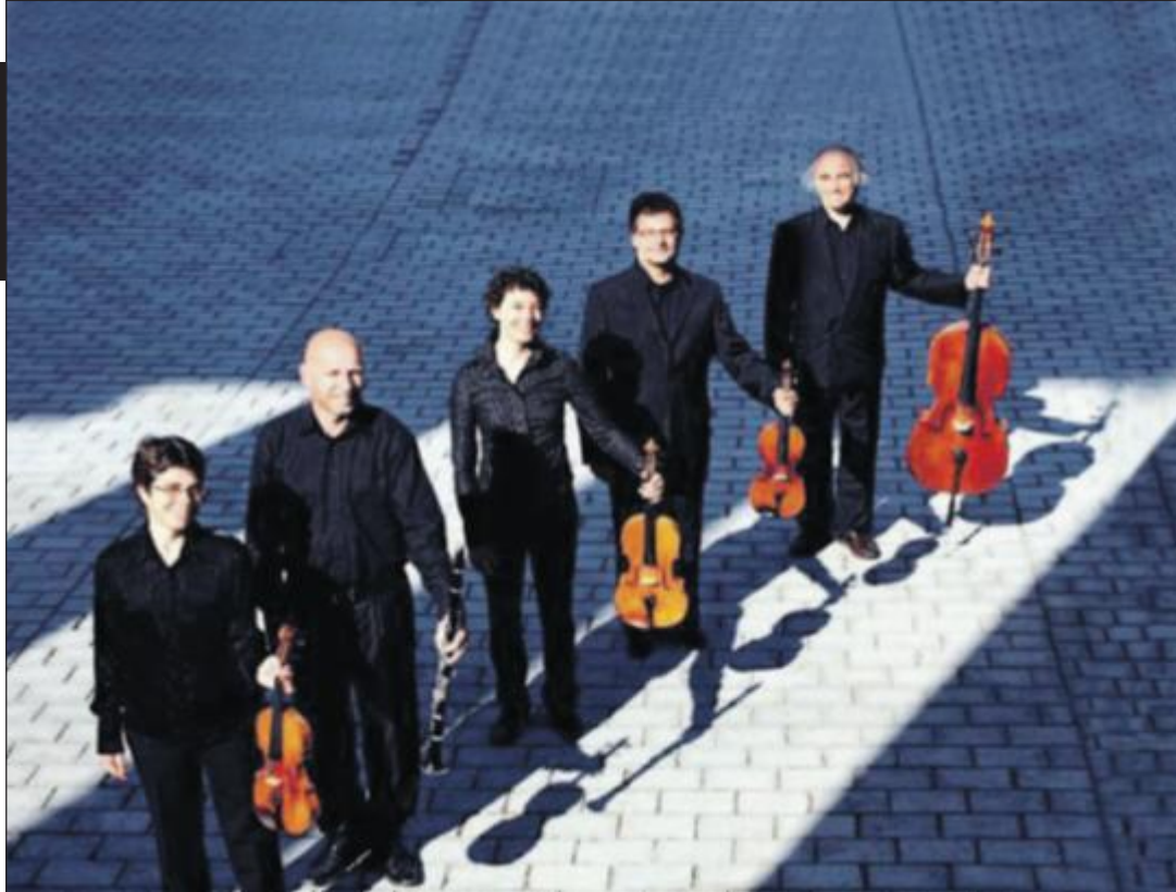
«Oslo Philharmonic Chamber Group» består av musikere fra Oslo Filharmoniske Orkester.