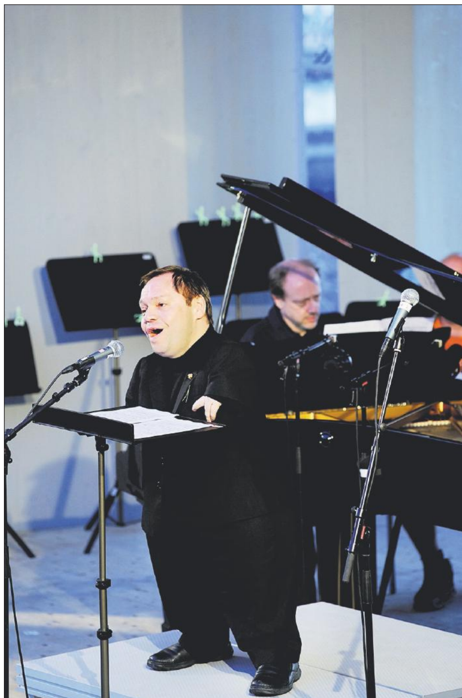
Thomas Quasthoff er en av vår tids bemerkelsesverdige fenomener som formidler tekst og tone på et genialt vis. Her under Risør Kammermusikkfestival 2008.

Quasthoff, et fenomen i seg selv, griper tilhøreren fra første sekund. Allerede i «Gute Nacht» føler vi at her er noe stort på gang. Ujålete og direkte formidler han tekst og tone. Hans uttrykksregister er overveldende og han unngår fullstendig å bli melodramatisk. Lytt til hans