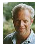
av Kjell Moe