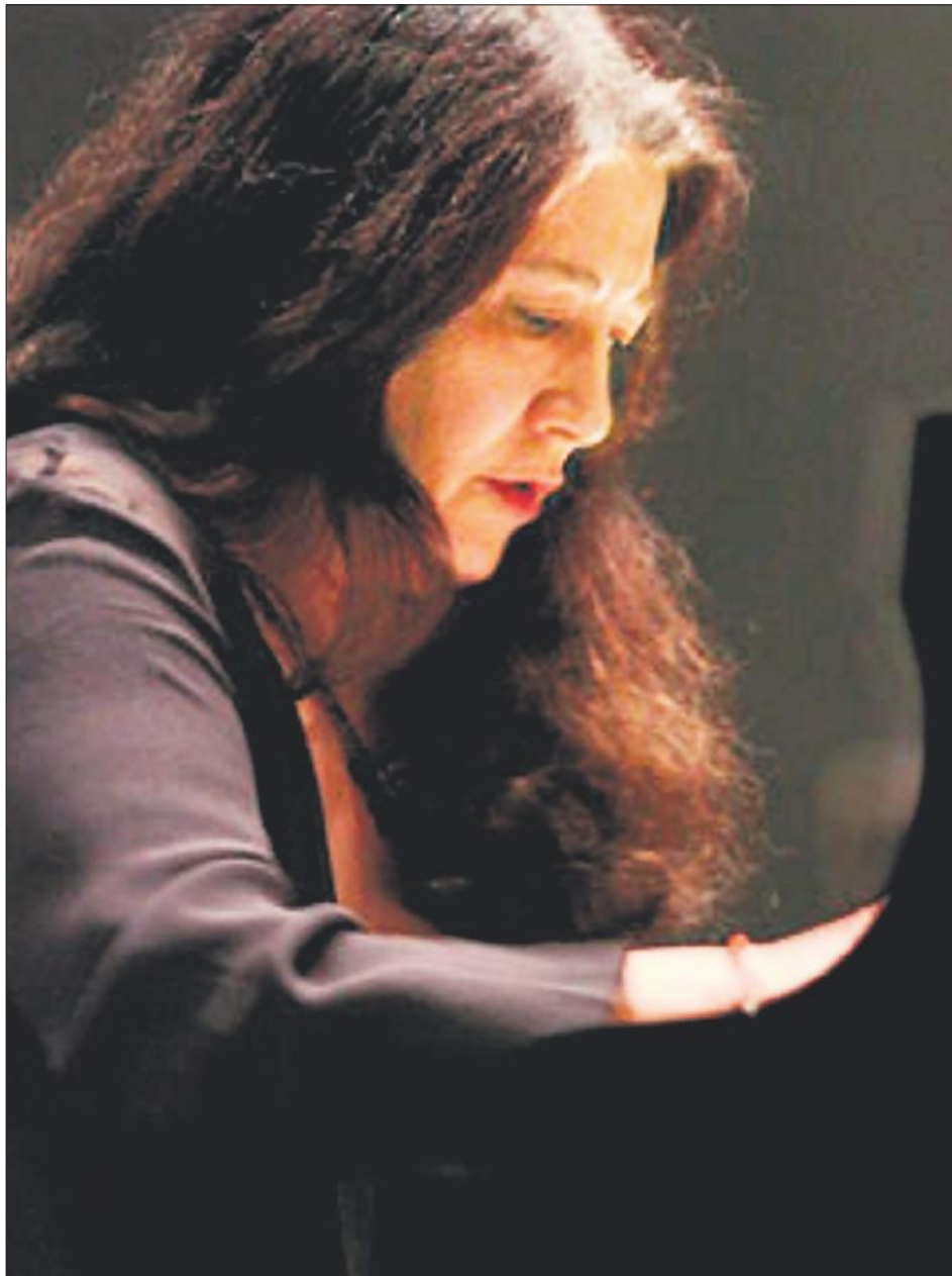
Martha Argerich har alltid skydd mediene, men på denne DVD-en tar hun imidlertid bladet fra munnen.

Martha Argerich har som kjent en teknikk uten sidestykke, Vi hører små snutter fra finalen av Ravels G-dur og førstesatsen av Prokofievs tredje, som beviser dette. Hun mener at sistnevnte faller lett for henne å spille. Han kommer ikke med noen «dirty tricks». Hun forteller en herlig historie om da Gulda hadde sagt til jazzpianisten Erroll Garner, at han syntes musikken hans hadde en del til felles med Debussy.