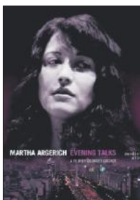
DVD «Evening Talks» Portrett av Martha Argerich Medici arts