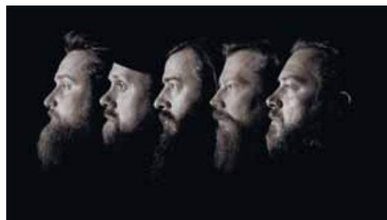
TRADISJONSBERERE: Nytt Oslo-band, på ny Tromsø-label.