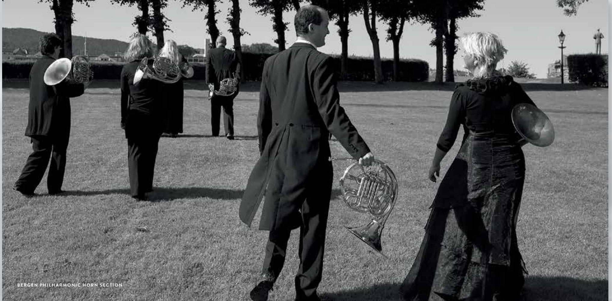
BERGEN PHILHARMONIC HORN SECTION