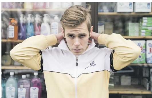
Raust: Lars Vaular inviterer lytterne inn.