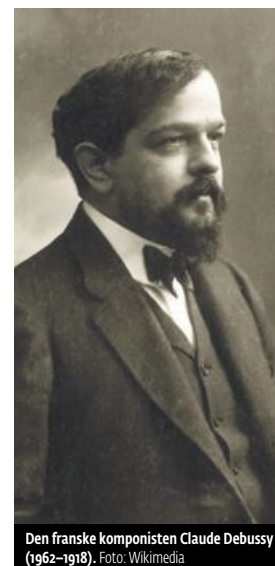
Den franske komponisten Claude Debussy (1862–1918).