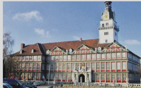
Arbeidsplassen til komponisten Michael Praetorius (ca. 1571–1621): Slottet i Wolfenbüttel, familiesetet til hertugane av Braunschweig-Lüneburg.

Komponisten Michael Praetorius, som i Noreg er mest kjend for harmoniseringa av julesongen «Det hev ei rose sprunge», var hoffkapellmeister i Wolfenbüttel i tida rett etter 1600, og gjorde byen til