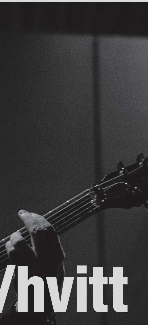
Roy Orbison i fin stil under «Black & White Night».