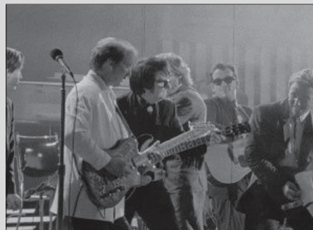
The Big O slår seg løs med T-bone Burnett, Elvis Costello og Roy Orbison

Dylan, de skulle låne en gitar av Tom Petty, og så endte dette som kjent med at disse fem spilte inn albumet «Traveling Wilburys Vol 1», med hitlåten «Handle With Care». Der Orbison sang det minneverdige refranget i kjent stil: «I'm so tired of being lonely/I still have some love to give». Det hørtes som vanlig ut som om han mente hvert ord. Den aller største sangen fra dette albumet er likevel Orbisons «Not Alone Anymore». Men Roy Orbison fikk også gjort ferdig sitt eget album, «Mystery Girl», oppkalt etter sangen «She's A Mystery To Me», skrevet og produsert for ham av U2.