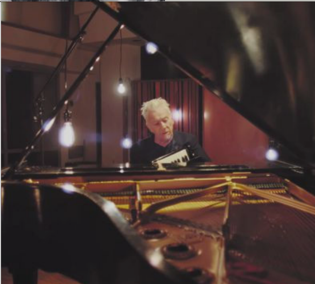
John Cale tolkar Leonard Cohens «Hallelujah».