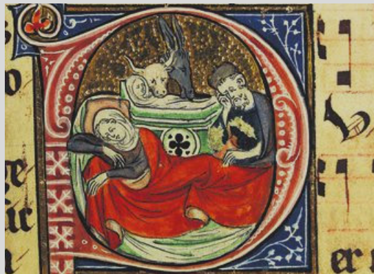
Miniatyr frå Sherbrooke missal (ca. 1310), ei av dei eldste engelske messebøkene frå mellomalderen.