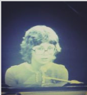
Radka Toneff i 1971.

kjellaren på NRK, før opptaket som vanskeleg lét seg sjangerplassere så kjapt. Berre prov sjølv.