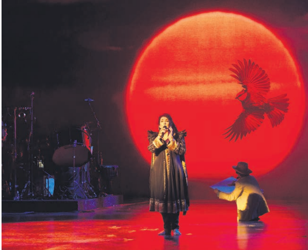
Kate Bush på konserten som nærma seg musikkteater i form, i London i september 2014. Pressefoto