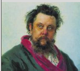
Modest Musorgskij (1839–1881) nokre veker før han drakk seg i hel. Målarstykkje av Ilja Repin, 1881.