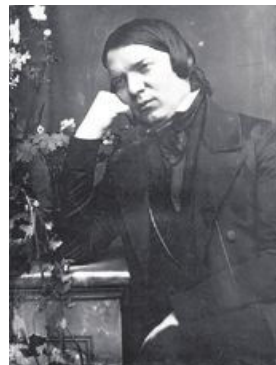
Komponisten Robert Schumann (1810–1856) på ein daguerreotypi frå 1850.

Noko av det finaste på plata er sistesatsen «Bewegt» i Sonate nr. 2 i d-moll , op. 121, som