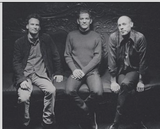
Trioen: Larry Grenader (bass), Brad Mehldau (piano) og Jeff Ballard (trommer).