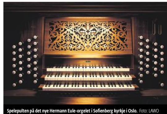
Spelepulten på det nye Hermann Eule-orgelet i Sofienberg kyrkje i Oslo.