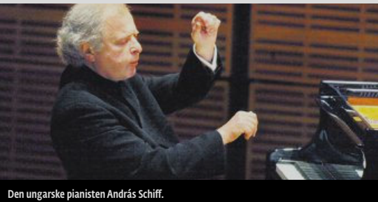
Den ungarske pianisten András Schiff.