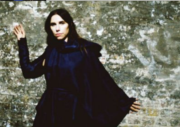
PJ Harvey har gjeve ut ei av dei beste platene så langt i år.