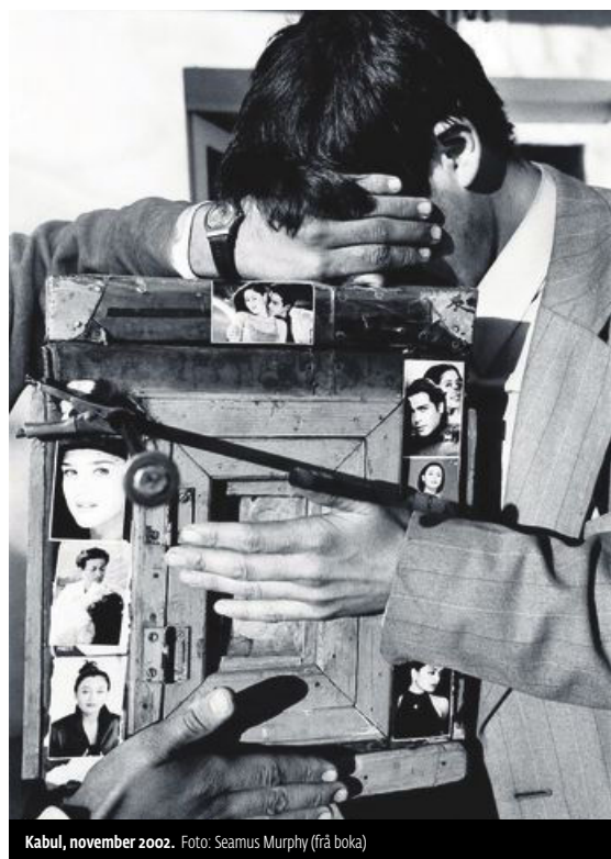
Kabul, november 2002.