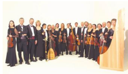
Barockensemblet La Stagione Frankfurt.