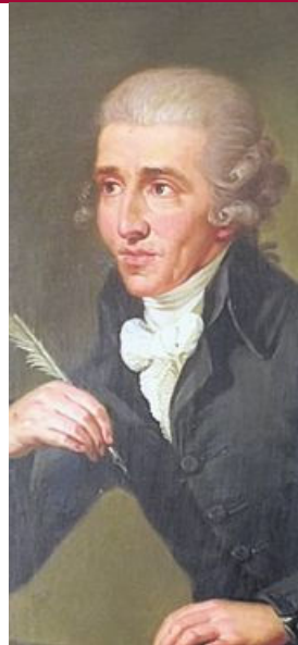
Den austerriske komponisten Joseph Haydn (1732–1809).