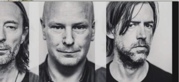
Radiohead anno 2016.