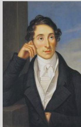
Sein bløming: Den tyske romantikaren Carl Maria von Weber (1786–1826) var ikkje noko vedunderbarn.

Ouverturnane er uvanleg temarike, noko som har ein logisk grunn: Weber hadde for vane å laga Ouverturen heilt til slutt i skapingsprosessen av operaen, etter at alt anna var ferdig. Slik kunne han plukka musikalske tema frå ariar og kor og baka dei inn i det instrumentale for-