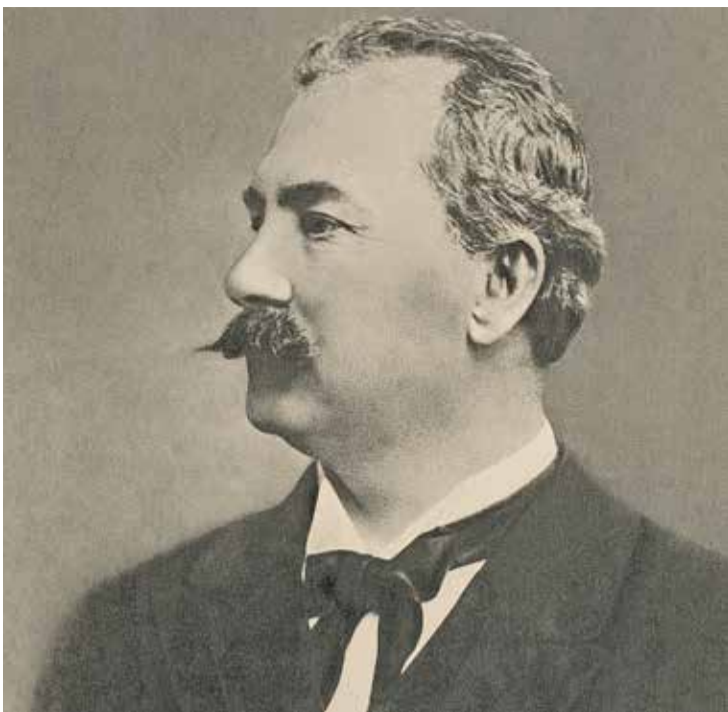
Johan Svendsen var en de norske komponistene som søkte til Leipzig.