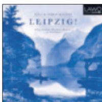
«Leipzig» Verker av Grieg, Svendsen, Hartmann, Reinecke Oslo Kammerakademi LAWO LWC 1058 (CD)