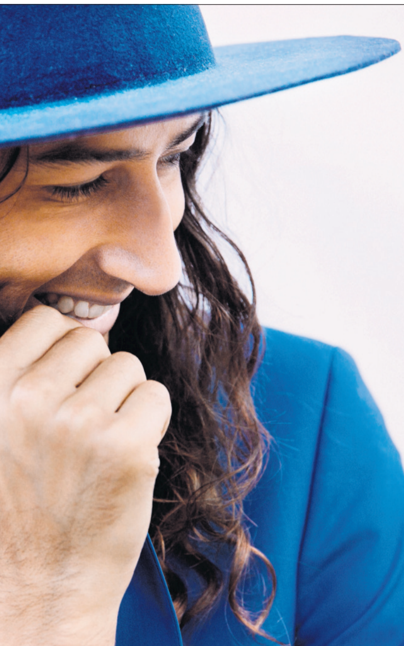
atisk og umiddelbar gjenkjennelig visuell arv å lene seg på».