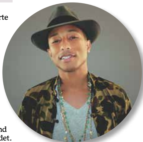
Soloalbum nummer to fra Pharrell Williams.