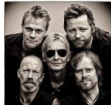
NYTT ALBUM: Bjølsen Valsemølle.